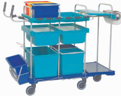
80770 SmartCar Competence WL2